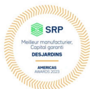
Meilleur manufacturier, capital garanti