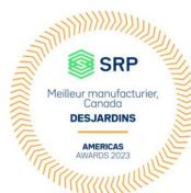
Meilleur manufacturier, Canada